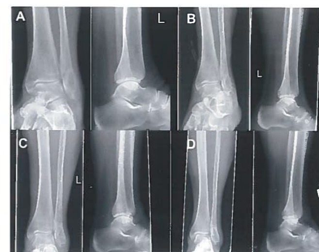
Abb. 1: Röntgenbild einer 76-jährigen Patientin mit einer Fraktur nach AO Typ 44 B1.1 (A, präoperativ), die mit IlluminOss®, dem photodynamischen Knochenstabilisierungssystem, behandelt wurde. Die postoperativen Ergebnisse nach 6 (B) und 12 Wochen (C) sowie nach 13 Monaten (D) zeigen eine ausgezeichnete Frakturheilung

In unserer prospektiv randomisierten Studie wurden zwei Studienarme nach Fraktur der distalen Fibula bei geriatrischen Patienten betrachtet. Der erste Arm repräsentiert die Kontrollgruppe, welche konventionell mittels ORIF mit Drittelrohrplatte in AO-Technik versorgt wurde und mit 20 kg Teilbelastung an Unterarmgehstützen für 6 Wochen postoperativ behandelt wurde. Patienten im Arm 2 wurden mittels des minimal invasiv einzubringenden intramedullären „Photodynamic Bone Stabilization System“ (IlluminOss®) stabilisiert und durften ab dem ersten postoperativen Tag schmerzadaptiert voll belasten. Primärer Zielparame- ter des klinischen Outcomes war die Funktionalität des Sprunggelenks, objektiviert durch den Score nach Olerud. Sekundäre Zielparame- ter waren Art und Ausprägung postoperativer Komplikationen. Diese wurden unter-