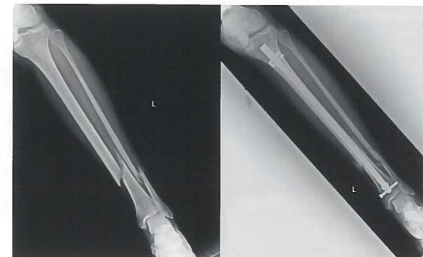
Abb. 1: Röntgenbild einer 35-jährigen Patientin prä- und postoperativ. Die Bohrung von anteromedial nach posterolateral ist die wahrscheinlichste Ursache für die postoperativ aufgetretene Peroneusläsion

Daten von Patienten, die aufgrund von Unterschenkelchaftfrakturen an der Wiener Universitätsklinik für Orthopädie und Unfallchirurgie im Zeitraum von Jänner 2000 bis Dezember 2017 operativ versorgt wurden, wurden retrospektiv erhoben und ausgewertet. Die zur Verfügung gestellten Daten wurden mithilfe von deskriptiver Statistik und dem Chi-Quadrat-Test aufgearbeitet. Insgesamt wurden 1159 Patienten eingeschlossen. Das durchschnittliche Alter der Patienten betrug 43,9 \pm 19,8 Jahre, der jüngste war 1 Jahr und der älteste 93